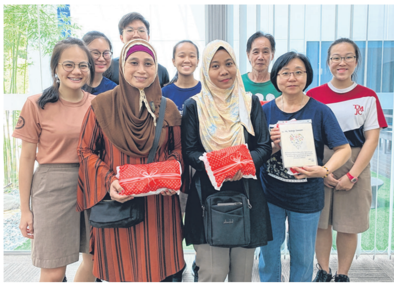
学院行政人员、校工、保安人员与学生合影。学生献上感恩卡和小礼包。

个人卫生的好习惯，也希望学生能体会校工清理食堂的辛劳，在用餐后会主动自觉地清理餐桌，从而减轻校工的负担。