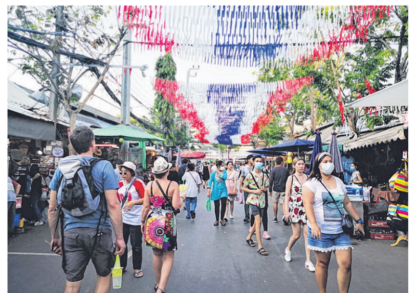
到曼谷乍都乍周末市场的旅客，约一半都戴上了口罩。

当我们回首时，会发现本次疫情之下的种种决定，有朝一日会体现在更深远的层次上，或更好或更差，影响着我们未来的人生。