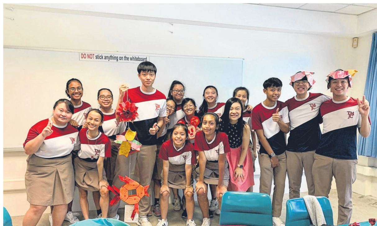
淡滨尼美廉初级学院的同学和自己的级任老师一起制作灯笼。