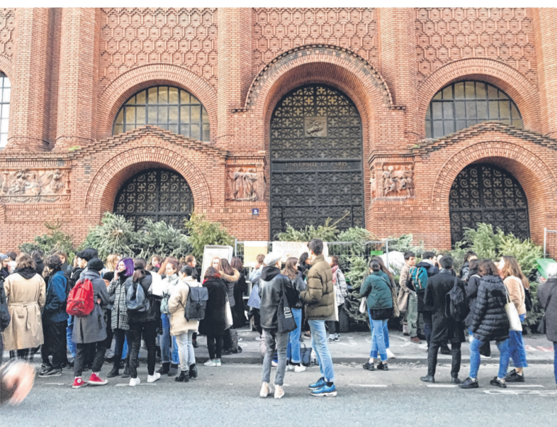
寒冷的冬天，红砖的学楼在杉树淡淡的香味中显得特别漂亮。

路过别的学楼，我看到同学们用了大垃圾桶把门都封住了。收垃圾的工作人员来清理垃圾时不但没有埋怨同学们移走垃圾桶，还让大家罢考加油。这时我居然听到身旁的同学感叹：“垃圾的气味好香啊！”