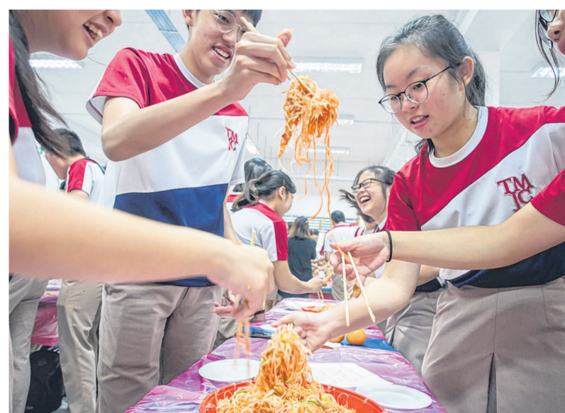
全校师生齐捞鱼生。

每个人各自带来了红包封，和自己的同伴齐心在限小时内完成灯笼的制作。刚开始时，有些同学手忙脚乱，不知要如何把红包封钉在一起。有些则别出心裁，自己携带了新年的迷你小饰物，挂在灯笼的下方，借以表达对老师和同学的祝福。例如金色的鲤鱼，寓意“年年有余，如鱼得水”；橘子代表“大吉大利，如